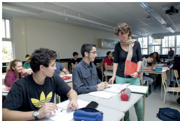
Collège international Marie-de-France de Montréal, Canada