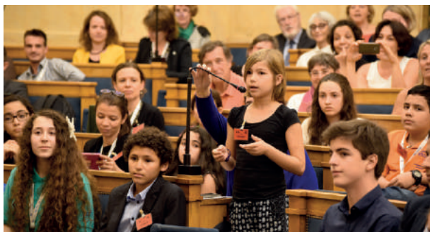
Finale d'Ambassadeurs en herbe 2016, dans la salle Colbert de l'Assemblée nationale, à Paris le 11 mai 2016.

Les élus participent également aux travaux de l'Observatoire pour les élèves à besoins éducatifs particuliers (OBEP), créé par l'AEFE en juin 2016.