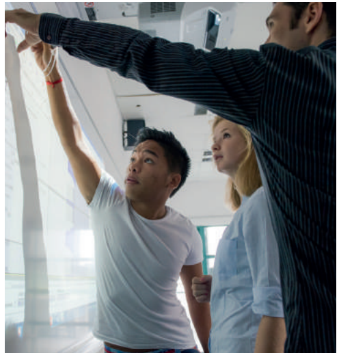
Lycée français de Singapour

100 % des copies corrigées numériquement