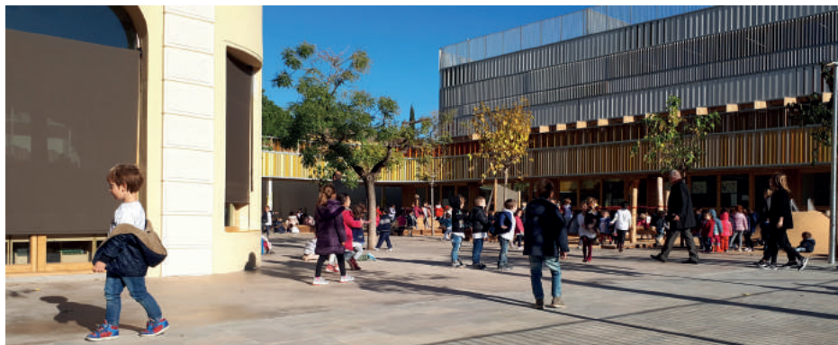
L'école maternelle du Lycée français de Barcelone, Espagne

Le réseau des établissements français à l'étranger est organisé en 16 zones de mutualisation. La mutualisation permet au réseau de se développer dans un cadre institutionnel qui accroît l'offre de services, la déconcentration des moyens et le déploiement de la politique de l'Agence au plus près du terrain.