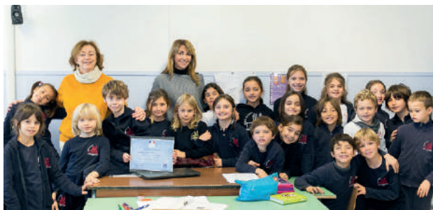
École Sacro Cuore Trinita Dei Monti de Rome, Italie

Elle garantit par ailleurs, la mise à disposition de nombreuses ressources pédagogiques et services par l'ensemble des acteurs et partenaires du dispositif (Institut français, CIEP, TV5Monde ...).