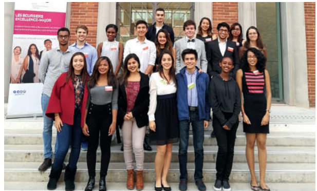
Des boursiers Excellence-Major à la réunion d'accueil organisée au lycée Pierre-de-Fermat à Toulouse, le 13 octobre 2016.