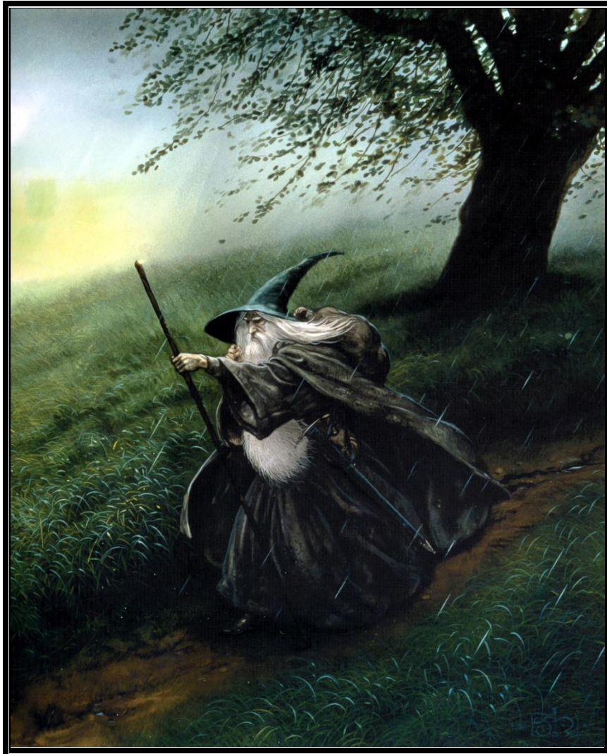
Gandalf le Gris